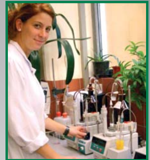
Ein integriertes Betriebslabor ist Voraussetzung für schnelles Handeln.

Nicht zu vergessen die vielen Pumpen und Leitungssysteme, die alle aus Edelstahl gefertigt sind. Allein in den letzten drei Jahren wurden hier über zwei Kilometer Rohrleitungen verlegt. Sie gewährleisten, dass alle Produktwege in hygienisch einwandfreiem Zustand gehalten werden können. Vom Ausmischtank bis zum Flaschenabfüller sind permanent 6000 Liter Fruchtsaft unterwegs.