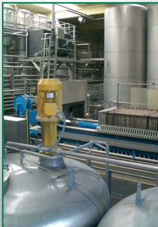
Die Abteilung Saftaufbereitung ist das Herz jedes Fruchtsaftbetriebs. Hier entscheidet sich die Qualität.